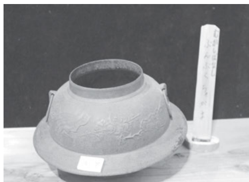
【図4】民具と昔話のタイトルの展示例

当館の昔の道具コーナーには、第3・4学年生が、「きょう土につたわるねがい」という単元の学習を進める際に、学校・学年あるいは個々の児童が何回も足を運び学習できる素材が豊富にそろっている。そこで、子どもの目線に立って昔話に出てくるなじみの道具類を使って身近に感じることができるようにした。（図4）。