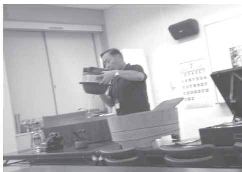
【図5】模擬授業の様子

本館の事業の一つである「授業支援事業」は、小学校第3学年の社会科の「古い道具と昔の暮らし」の学習の支援として資料館に収蔵されている昔の道具を活用し、各学校の学習の充実に資する目的で実施されている。本事業は、授業の支援活動を行うことを主にしており、子どもたちが、楽しさや成就感を得られる授業を目指した（図5）。