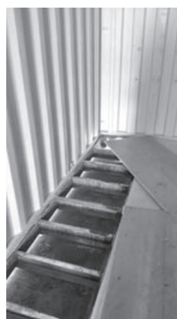
図-2 コンテナ解体の様子。コンテナ下部の空隙が生息環境となっていた。