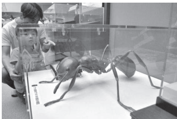
図-3 ヒアリの拡大模型を用いた展示の導入（人と自然の博物館）。