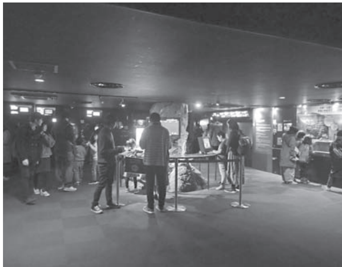
図 2 新江ノ島水族館の深海展示

このような流れの中で、新江ノ島水族館では 2004 年より、国立研究開発法人海洋研究開発機構と共同で、化学合成生物群集の長期的な飼育方法に関する研究を進めている。長年にわた