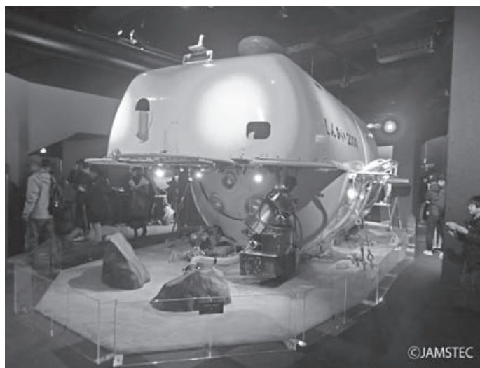
図1 有人潜水調査船 しんかい2000

1984年には海洋科学技術センター（現：国立研究開発法人海洋研究開発機構）の有人潜水調査船「しんかい2000」（図1）によって、相模湾初島沖の水深約1100mにおいて大量のシロウリガイ類を主体とした化学合成生物群集が発見された。これは日本周辺における初の深海性化学合成生物群集の発見であった（Okutani and Egawa, 1985）。この生物群集は、とくに堆積物から浸出するメタンや硫化水素を利用する化学合成細菌を基幹とするため、湧水生物群集と呼ばれる。相模湾